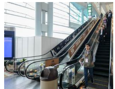
2. Escalator ad