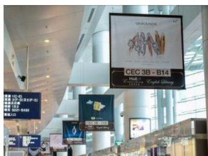
3.2. Overhead hanging banner along Hall 1 concourse