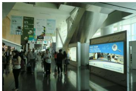
1.2. Self-built lightbox along hall concourses