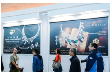
5. Hanging poster