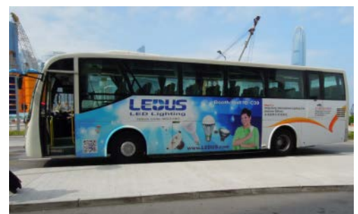
4. Shuttle bus sticker ad