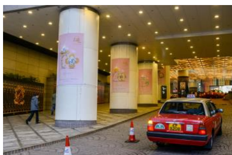
3.1. Pillar banner at Harbour Road entrance