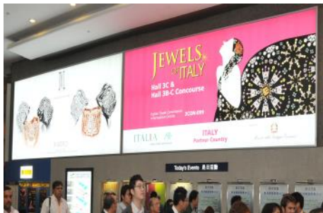
1.1. Lightbox at Harbour Road entrance

* Available to Hong Kong exhibitors only