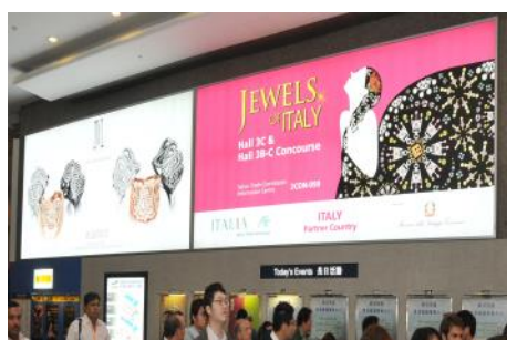
1.1. 港灣道入口燈箱廣告