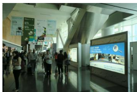
1.2. 各展馆大堂灯箱广告