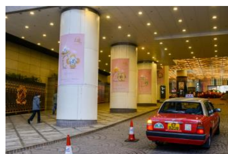
3.1. 港灣道入口圓柱式橫幅廣告