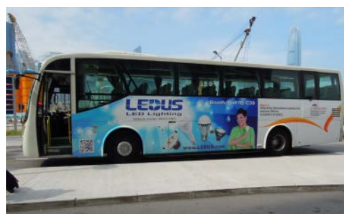
4. 大會穿梭巴士車身貼紙廣告