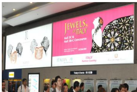
1.1. 港湾道入口灯箱广告