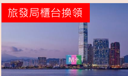
免費M+博物館一天入場門票