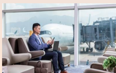
香港環亞機場貴賓室免費體驗