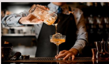
兩杯免費迎賓飲品

參觀香港貿易發展局在香港會議展覽中心舉行的香港鐘表展及CENTRESTAGE，從一系列專屬體驗中選擇一項禮遇：